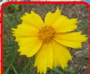
西日本各地で繁殖し在来種を 駆逐する特定外来種 オオキ ンケイギク (2017.5.28 門司)