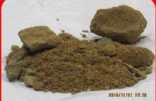
防衛・環境両省との辺野古埋 立て用土砂採取計画につい ての要請交渉に持ち込んだ奄美 の「 岩ズリ 」。 「これ、洗浄できますか」の質 問に、両省とも無言だった。 辺野古に持ち込まれる土砂へ の「外来生物」の混入は防げな いことが危惧される。 (2016.11.1)