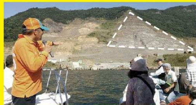
熊本県天草諸島 御所浦島 三角部分が一億年前の地層、「白垂 紀の壁」。恐竜や多種多様な化石が 見つかる天草ジオパークの一部 (2016.10.2撮影)