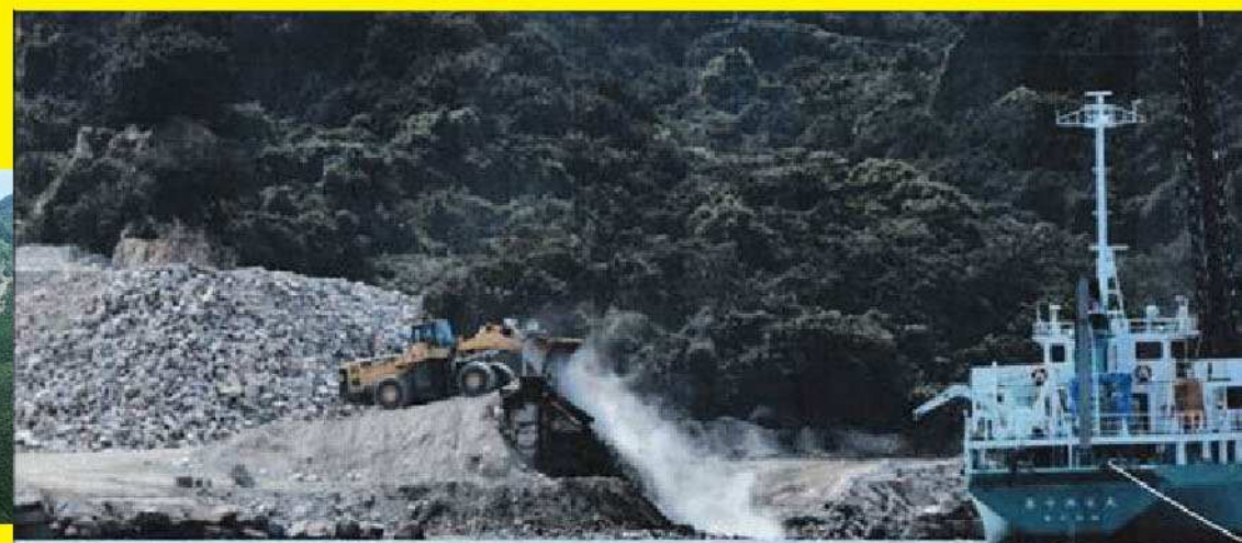
香川県 小豆島当浜地区 砕石を海水で洗浄し運搬船に積み込む(2016.8.27撮影)