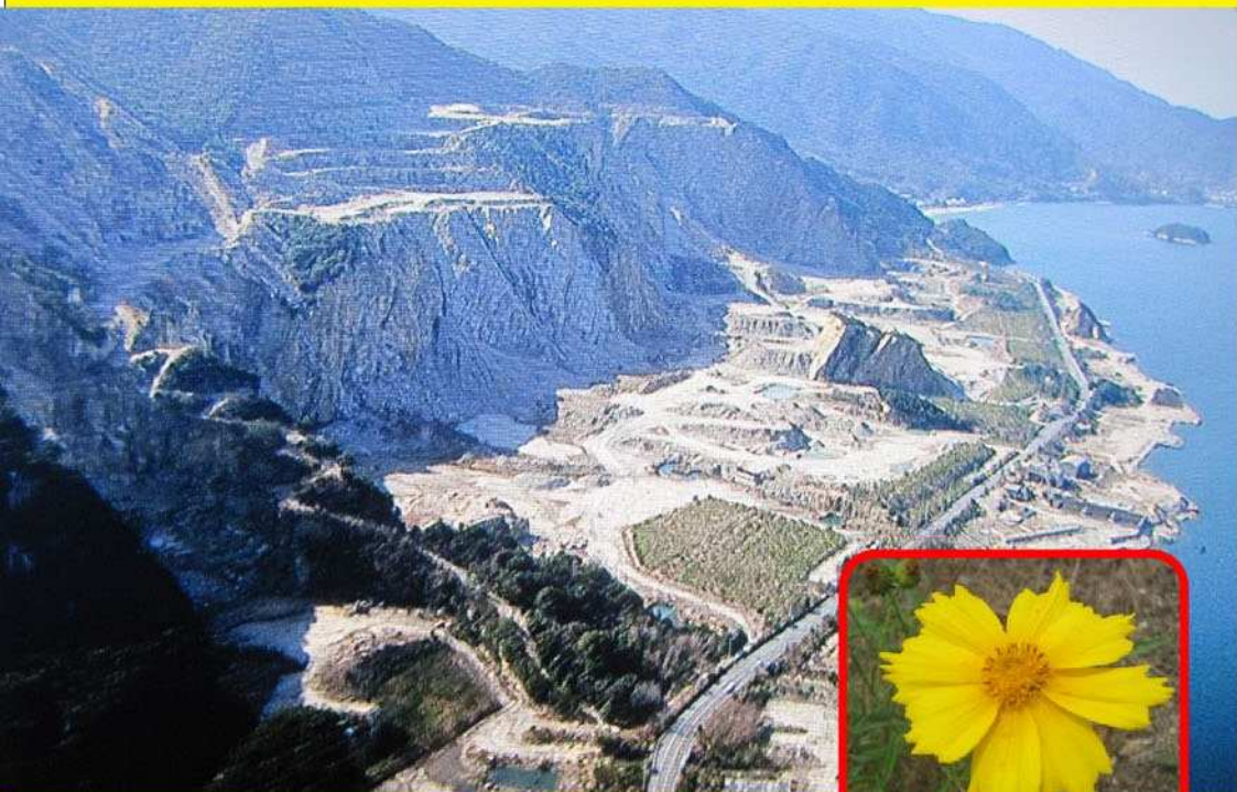
BSジャパン 「空から日本を見てみよう」小豆島編より 香川県小豆島灘山地区 (2016.3.15放映)