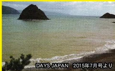
急峻な山が海に迫る奄美の地形。採石山の崩土が海に流れ込み、サンゴの海が真っ赤に。(2015.4.18)