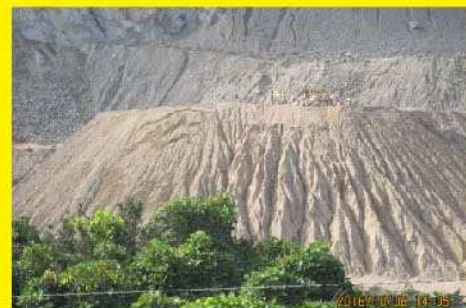
香川県小豆島 当浜地区 積み上げられた「岩ズリ」。斜面の装は 雨で流れ落 ちている証し、やがて海に流出する(2016.10.6撮影)