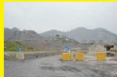
北九州市 門司区 (2015.5.13撮影)